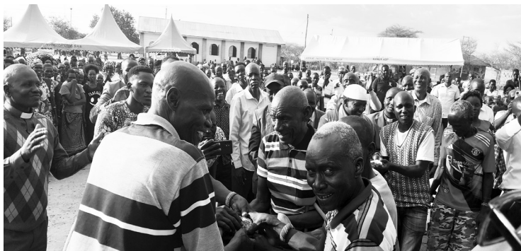
Acuerdo de paz en Kenia occidental.